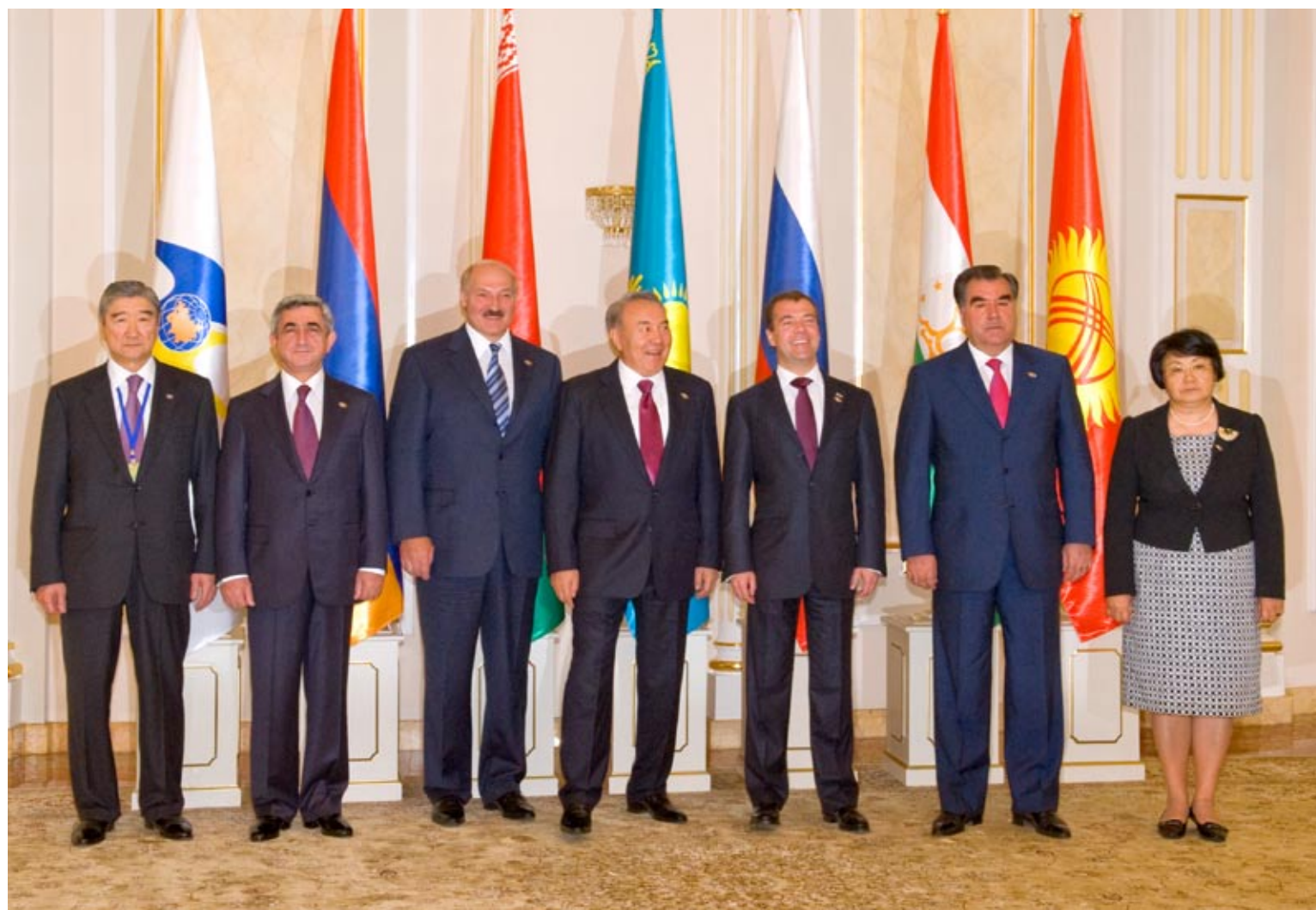
5 июля 2010 года. Астана, Межгоссовет ЕвРАзЭС

ЕвРАзЭС является одним из самых молодых, но масштабных региональных объединений. Его физические параметры таковы: занимаемая территория — 20,374 млн кв. км, т.е. 15% обитаемой суши мира, на которой проживает 181 млн человек — 2,7% мирового населения, производится 3,5% мирового валового внутреннего продукта, его доля в мировом экспорте товаров составляет 3,0%. ЕвРАзЭС обладает мощ-